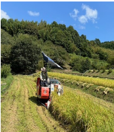
8月23日 稲刈りの様子 今年も豊作でした。